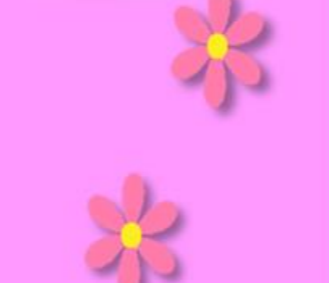
ララ♀ マンチカン マンチカン姉妹の姉です★ ツンのみでテレビは無いクール女子です。