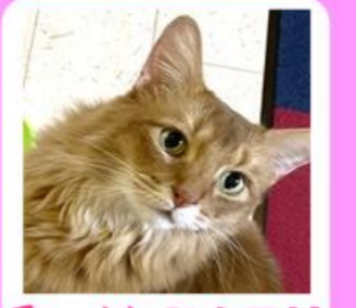
モフン♂ カチンロップ とっても優しい♡ フサカワモフモフくん(´▽`)