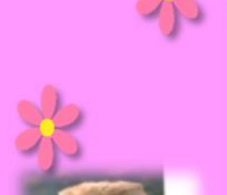
ピアンカ♀ マンチカン 猫カフェに新しく仲間入り♡短い足で 必死におもちゃを追いかけます♪