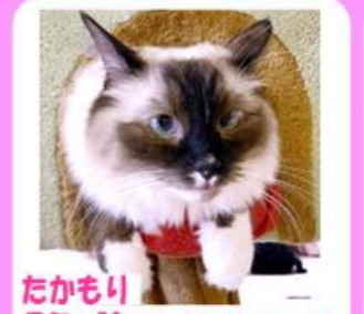
チャーハン♂ ソマリ 常に動いている活発な男の子! 玄関には別荘があります♪