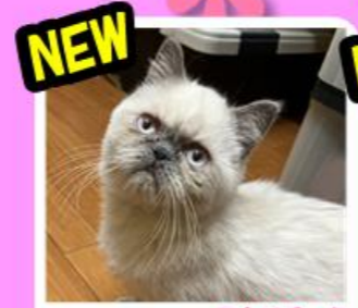
NEW マシマシ♂ エキソチック 郡山店初のエキソチック!その愛くるしい お顔にスタッフめろめろ!