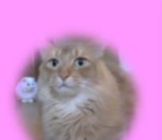
たかもり 隆盛♂ ラグドール 靴下柄の足がチャームポイント☆ 甘えん坊で突進してくるので注意!