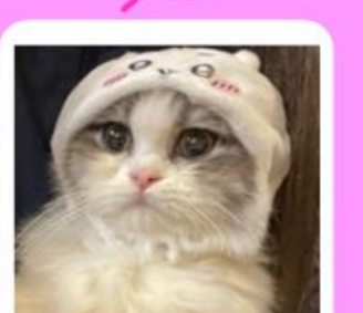
Baron♂ シュガーフォールド まんまるおめめでうるうるです♪ かくれんぼが大好き♪見つけてね!