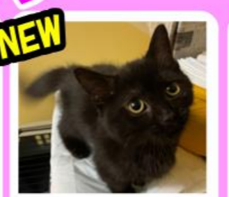
NEW グレーテル♂ マンチカン キャラが立ってる黒猫様★ 元気いっぱい!おもちゃで遊びたい!