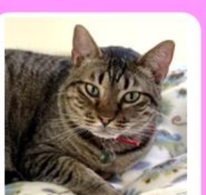
コタロウ♂ オシキャット 猫カフェの食いしん坊(A) ほっちゃりお腹のためダイエット中!