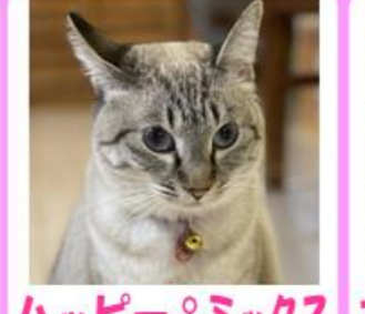
みるく♀ ミックス 「まいお」が大好きな一途な女の子♡ ご飯の時は積極的になります!